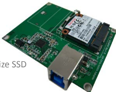
U213A + Half Size SSD

U213A 是一款实用型 USB 3.0 模块, 提供 SATA 6Gb/s 接口 mSATA SSD 转换到 USB 3.0。它内含一组 mini PCI-e connector 及一组 USB 3.0 / B type connector 对主机的链接。组装完成后, 它就是 USB 转 SATA 的外接盒。可正常运作于各种操作系统。例如 DOS, Windows 95, 98, XP, 2000, Vista, Win 7, Linux, Unix 等。U213A 转接卡允许 mSATA SSD 当成系统磁盘, 直接启动操作系统, 不需安装任何驱动程序。