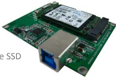
U213A + Full Size SSD